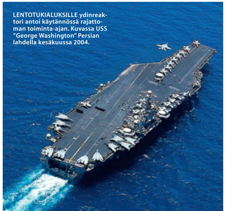
LENTOTUKIALUKSILLE ydinreaktori antoi käytännössä rajattoman toiminta-ajan. Kuvassa USS "George Washington" Persianlahdella kesäkuussa 2004.

PINTA-ALUKSIIN ainoa onnistunut ydinsovellutus olivat jäänmurtajat. Kuvassa toinen Suomessa rakennetuista "Taymyr"-luokan jokijäänmurtajista, "Vaygach".