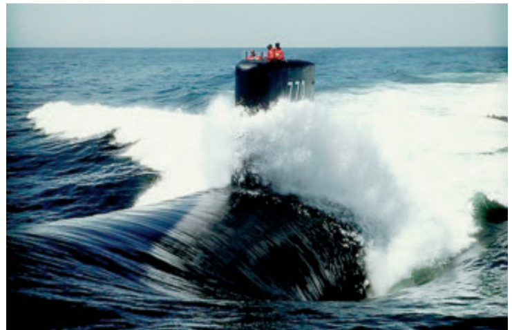
SUKELLUSVENESODANKÄYNNILLE ydinreaktori merkitsi vallankumousta.

Kaupallisella puolella ei ydinvoiman käyttöönotto laivoissa onnistunut aivan niin hyvin. Amerikkalaisten "Savannah" valmistui 1962 ja poistettiin käytöstä kahdeksan vuotta myöhemmin. Tekniikka pelasi, mutta talous ei. Saksalaisten "Otto Hahn" seilasi vuosikymmenen, mutta havaittiin sitten liian kalliiksi ja muunnettiin dieselkäyttöiseksi. Japanilaisten "Mutsu" oli oikea epäonnen Samurai, sitä vainosivat sekä tekniset ongelmat että mielenosoittajat.